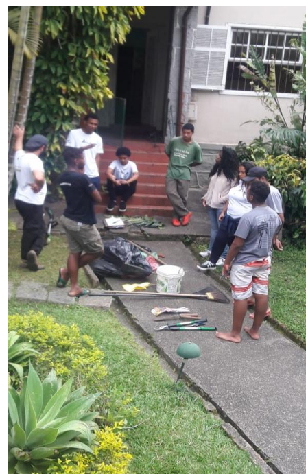
Foto 3: Atividade prática do núcleo de Educação Ambiental e Práticas Agroecológicas

O núcleo entende a Educação Ambiental como uma prática de construção de outros modos de vida, trata-se do resgate dos saberes ligados a cultura popular. Nesse sentido, tem-se a agroecologia como base de nossas ações, na qual contribui para pensar diferentes formas de resistência ao modelo de produção e consumo do sistema capitalista.