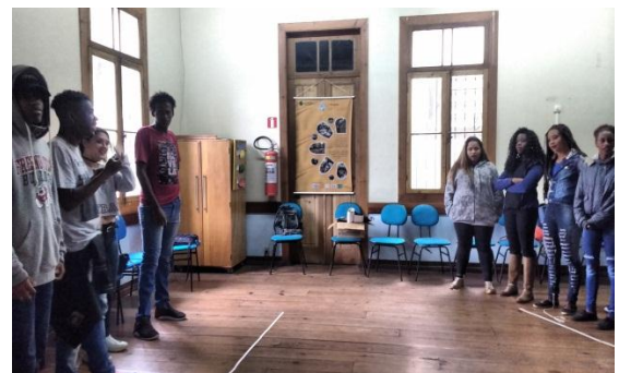
Foto 2: "Dinâmica das ilhas" – Oficina de Direitos Humanos e Cidadania